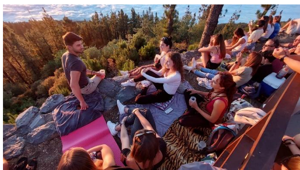
Egy kilátó a felhők felett, kilátással a Teidére, új barátokkal

Egy éve még csak eszembe se jutott a külföldön tölthető szakmai gyakorlat gondolata, azt pedig semmiképp sem gondoltam volna, hogy ilyen helyen és emberek között tölthetem el. Őszintén hálás vagyok ezért a lehetőségért.