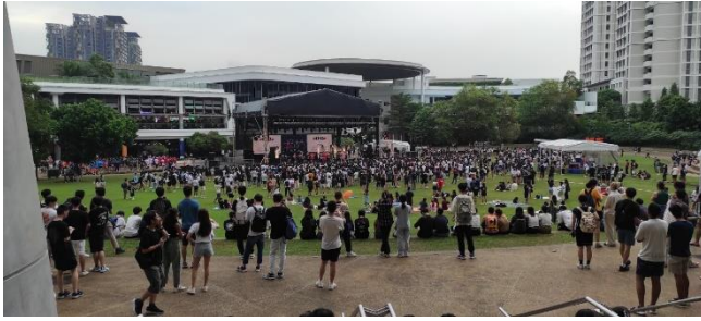
1 Nyitókoncert, a karok közötti sportversenyekre