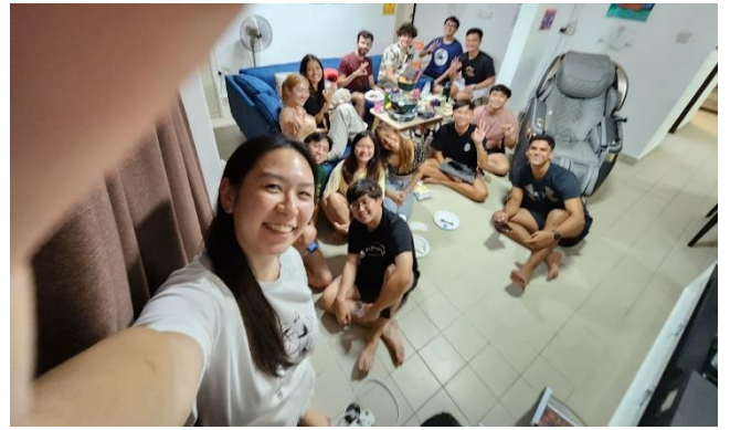
2 A blokkfelelősünknel tartott karaoke est