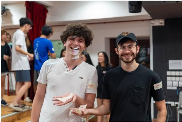
4 A szobatársammal a kollégiumban szervezett ismerkedős estén