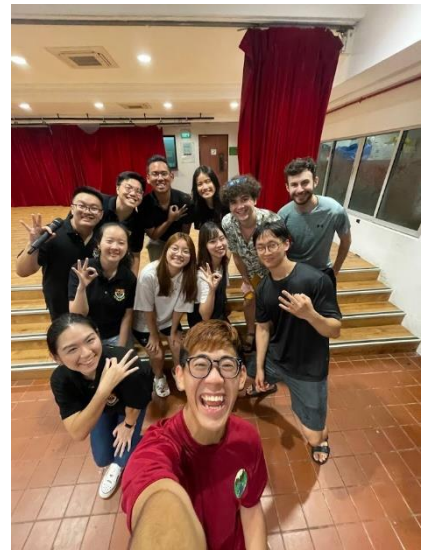
3 A blokkban lakó cserediákok és a blokk képviselői