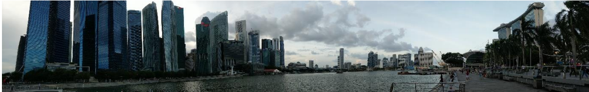
Szingapúr, Bay area

Korábban szüleimmal már meglátogattam Szingapúrt egy nyaralás keretében. Már akkor nagyon tetszett az ország. Lenyűgözött a rendezettség, az emberek gondolkodása és a rend, ami ott van. Miután hazajöttünk és láttam, hogy van lehetőségem kint tanulni egy félévet, azonnal eldöntöttem, hogy én oda fogok menni. Mindenképpen ki szerettem volna menni valahova, lehetőleg Európán kívülre, de ezzel a lehetőséggel felállt a teljes terv.