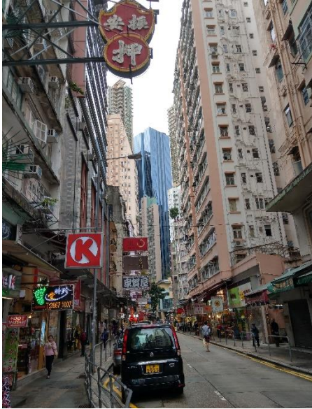
Hong Kong belváros

kifejezetten élveztem ezt a nemzetközi légkört és azt, hogy megismerhetem ennyi kultúra nézeteit, ha nem is mélyen. Szinte mindennap együtt reggeliztünk, együtt vacsoráztunk és sokat beszélgettünk a közös programjainkon is. Szerveztünk például közös kínai újévi vacsorát, de sokan együtt utaztak Dél-Kelet Ázsiában is. Sokán már szeptember óta ott voltak, így ők már nagyon összeszoktak, de nekem sem volt nehéz beilleszkednem. A másik, amit nagyon élveztem, hogy mindenki mást tanult. Volt politológus, fizikus, matematikus, közgazdász... Külön élmény volt, hogy a mindennapjaimat nem egy IT buborékban kellett töltenem, és a beszélgetések is változatosak voltak.